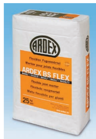
Foga med BS Flex